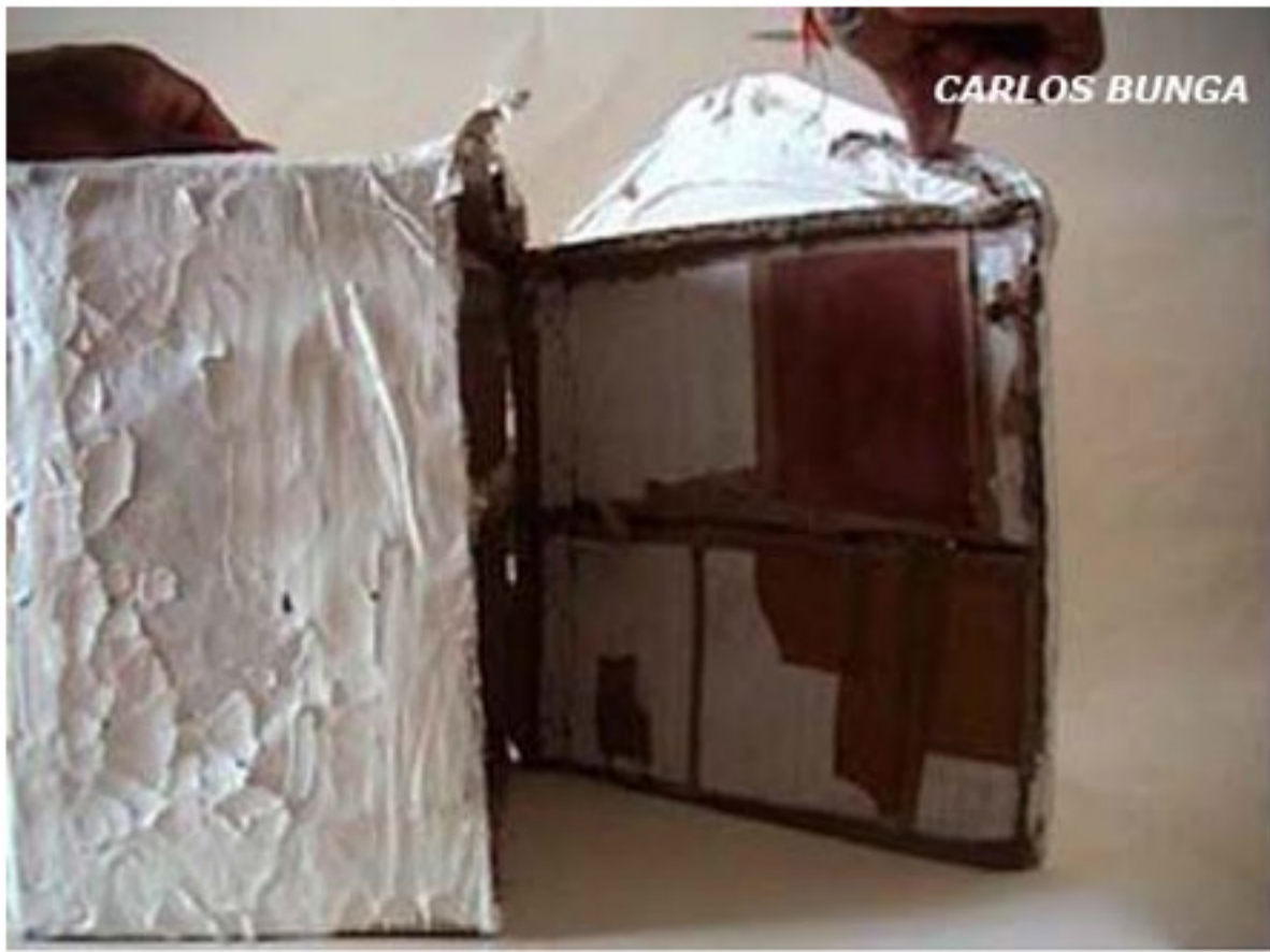
Corte 2002, Vídeo cor (PAL) com som, 49" (loop), 15" monitor e colunas